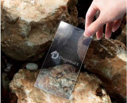
化学強化用特殊ガラス Dragontrail X

当社はグローバルに事業を展開しており、海外で活躍するチャンスも多いです。当日は法務業務の魅力、採用プロセスについてご説明します。皆様のご参加をお待ちしております。